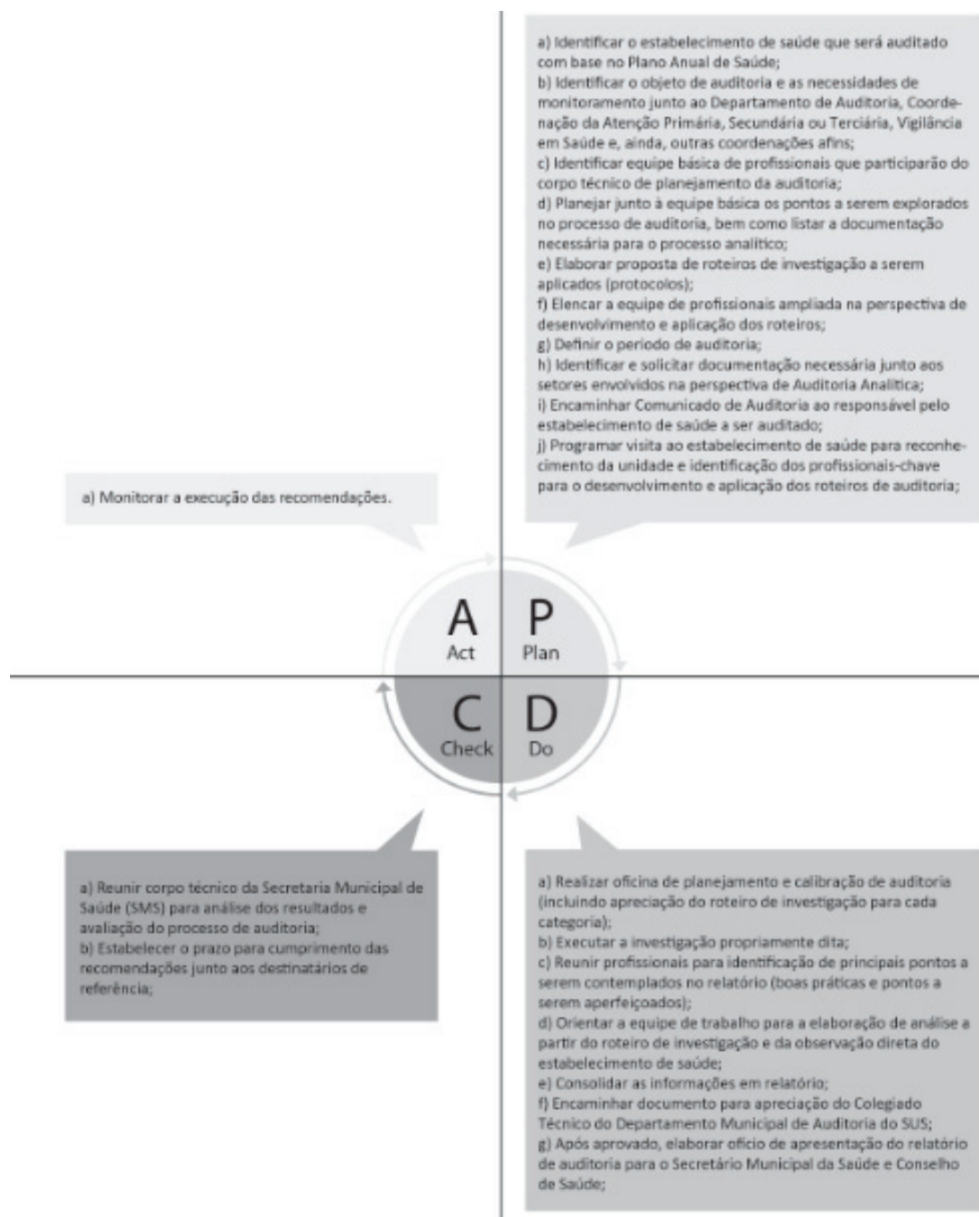
FIGURA 2. Ciclo PDCA aplicado ao processo de auditoria em saúde no município de Sobral, Ceará.