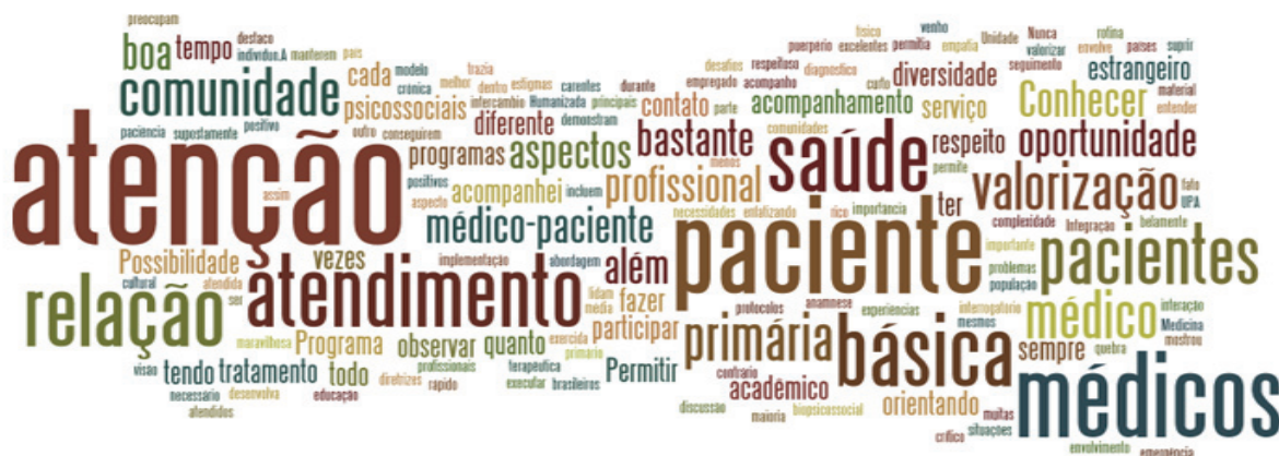
Figura 1 - Nuvem de palavras sobre pontos positivos do IESC no PMMB.