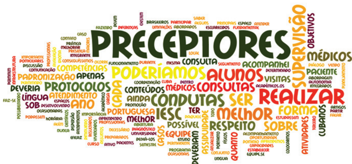
Figura 2 - Nuvem de palavras sobre aspectos a serem melhorados do IESC no PMMB.