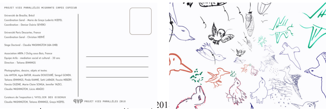
Figura 4. Cartão postal convite da Exposição L'Atelier des Oiseaux , realizado em colaboração com as mediadoras sócio culturais da Associação ARIFA

A identificação desse pesar coletivo contrasta com a presença dos pássaros no cotidiano das oficinas com elas realizadas. Eles estiveram presentes na canção lembrada no primeiro dia de trabalho, no pequeno objeto voador criado noutro dia, na foto de uma delas (onde os pássaros estão transfigurados em criança), no poema criado por uma delas sobre sobrevoar fronteiras, na risada divertida ou ainda foi usado para explicar qualquer coisa impossível de se dizer. Os pássaros serviram de sutura e cola para a realidade despedaçada dessas mulheres. No fim das oficinas, cada uma delas desenhou um pássaro que compõe o livro e a exposição que contam essa história de rasgos profundos e delicadas suturas, tentando colocar em continuidade um processo de mudança coletiva, propondo tornar pública uma frágil relação entre precariedade e riqueza, mas também servir para novas experiências e compartilhamentos.