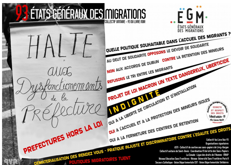
Figura 1. Cartaz da primeira sessão nacional dos États Généraux des Migrations , Montreuil, França. Projeto Vidas Paralelas Migrantes, 2018