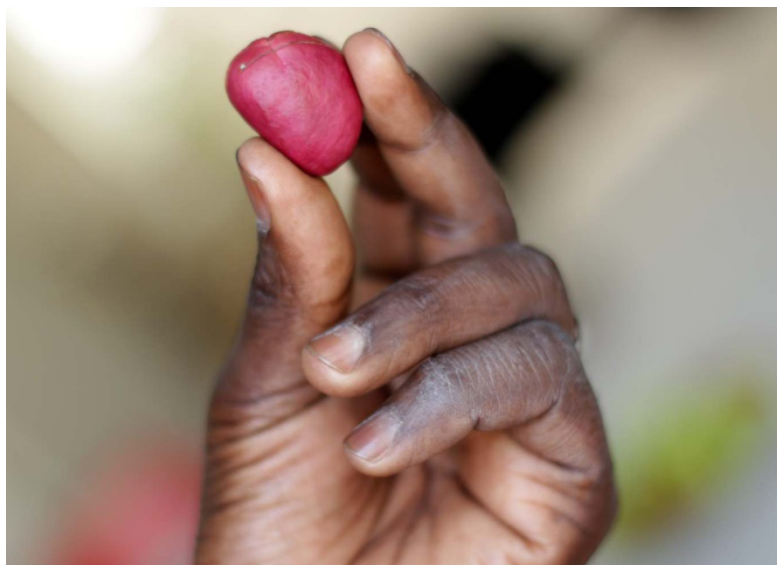
Figura 5. Página do livro La Recette de Koume (no prelo), realizado em colaboração com o Secours Catholique , França, Projeto Vidas Paralelas Migrantes, 2018